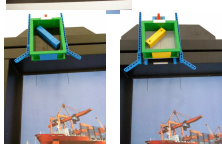
Koniec Opcja 2 - Niebieski/Żółte (przykłady)