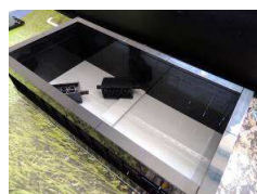
Koniec Opcja 2 – czarne (przkład)