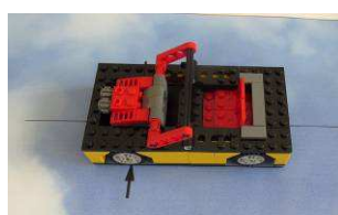
Koniec Opcja 1