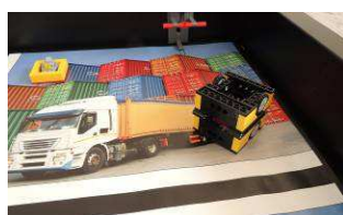
Koniec Opcja 2